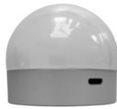
Leuchtkörper mit Akku